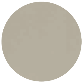
D161 DAFNE / DAPHNE

* The products are coated with a protective layer of film to reduce damages that may occur during production to a minimum and protect the glossy board until it becomes a finished product.